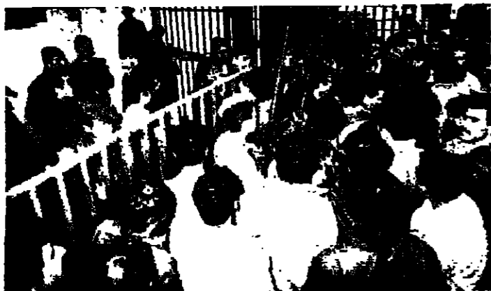
محاولة الخوف الى النصر الحكومي

تجمع اهالي منطقة البقاع الغربي امام القصر الحكومي صباح امس وطالبوا الحكومة بالتحرك السريع لتقديم المساعدات الميدانية للمواطنين في المنطقة التي تعاني من القمع الاسرائيلي ومن التمس في المزارع الغذائية والطيبة.